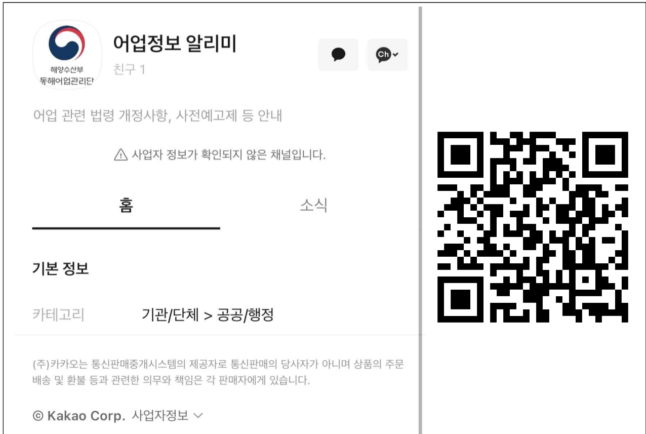
어업정보 알리미 홈화면, 친구추가 QR코드