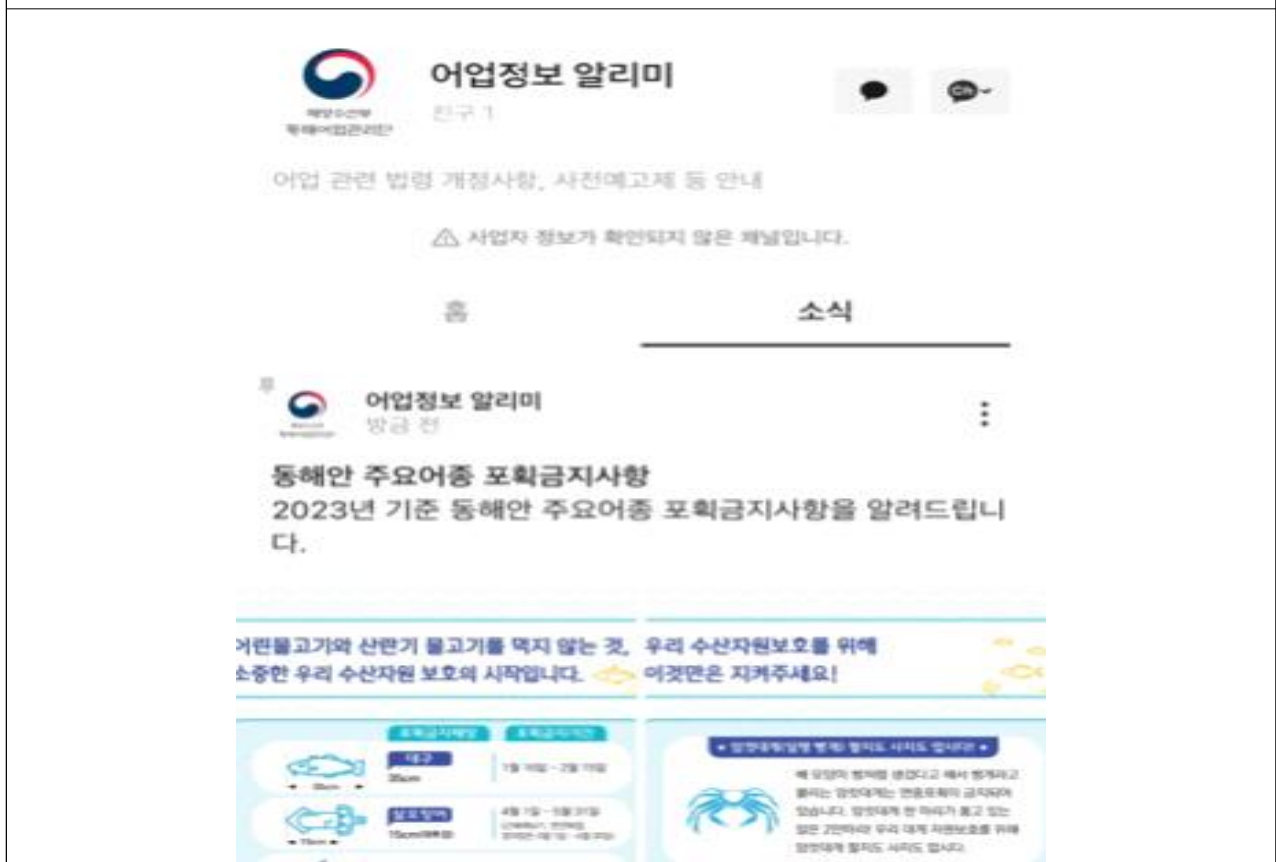
어업정보 알리미 고정 포스트