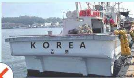
선명 표시 잘못된 예 (영문 표기 X)