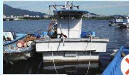
선미부(선명, 선적항), 선측 양현(선명) 미기재