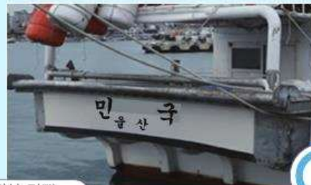
어선명칭 정상 기재