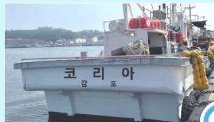
선명 표시 잘된 예 (한글 표기 O)