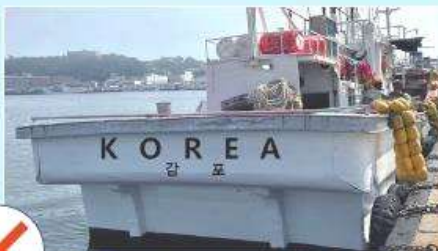
선명 표시 잘못된 예 (영문 표기 X)