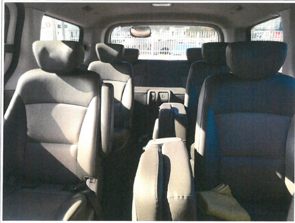
【 72도3363 】