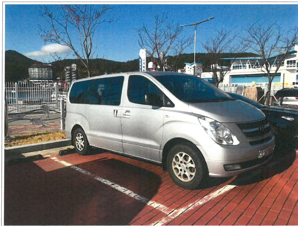
【 72도3363 】