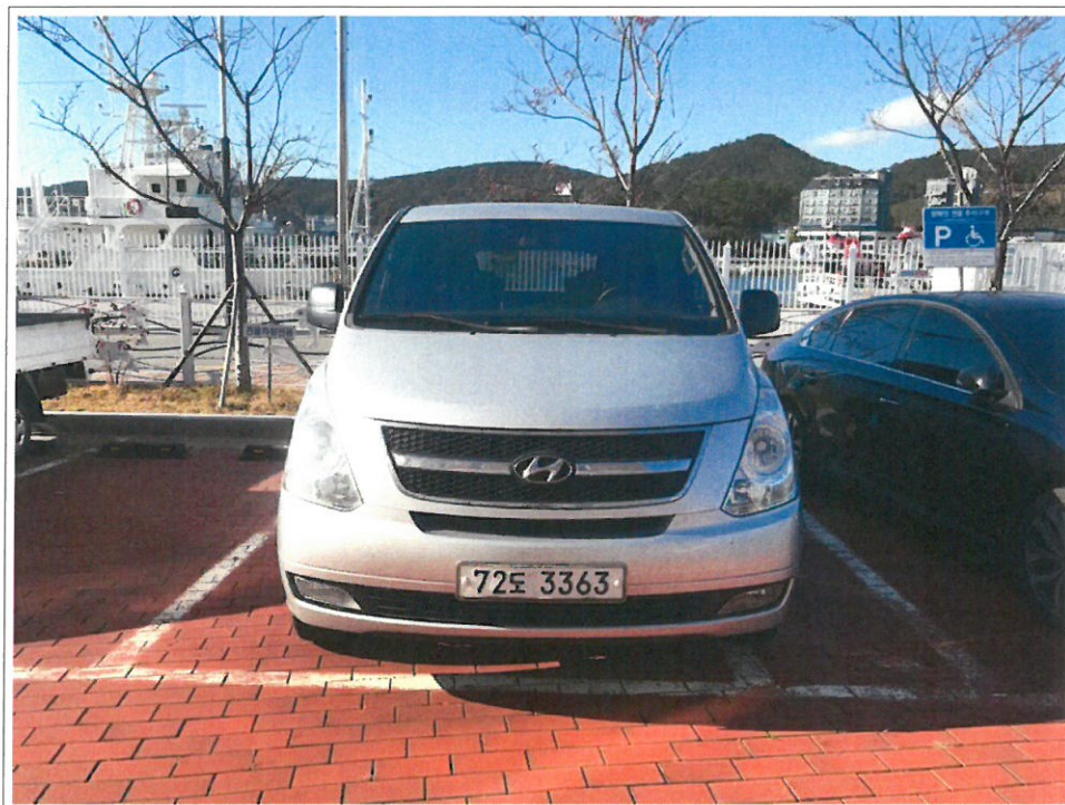
【 72도3363 】