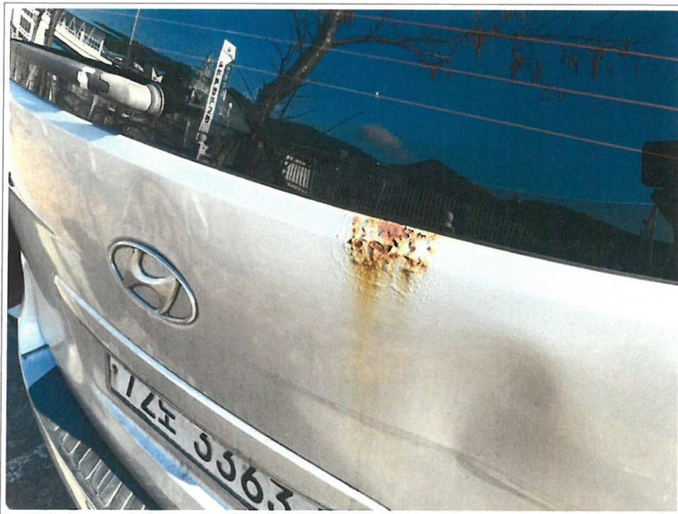
【 72도3363 】