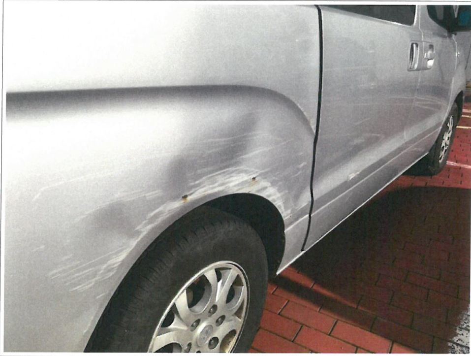
【 72도3363 】