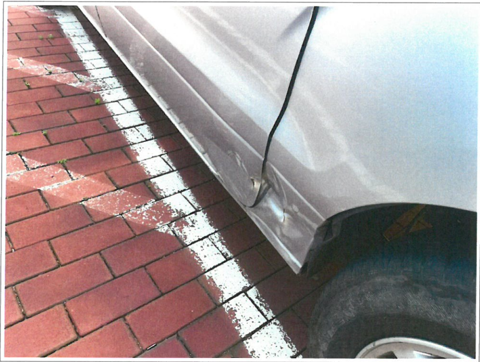
【 72도3363 】